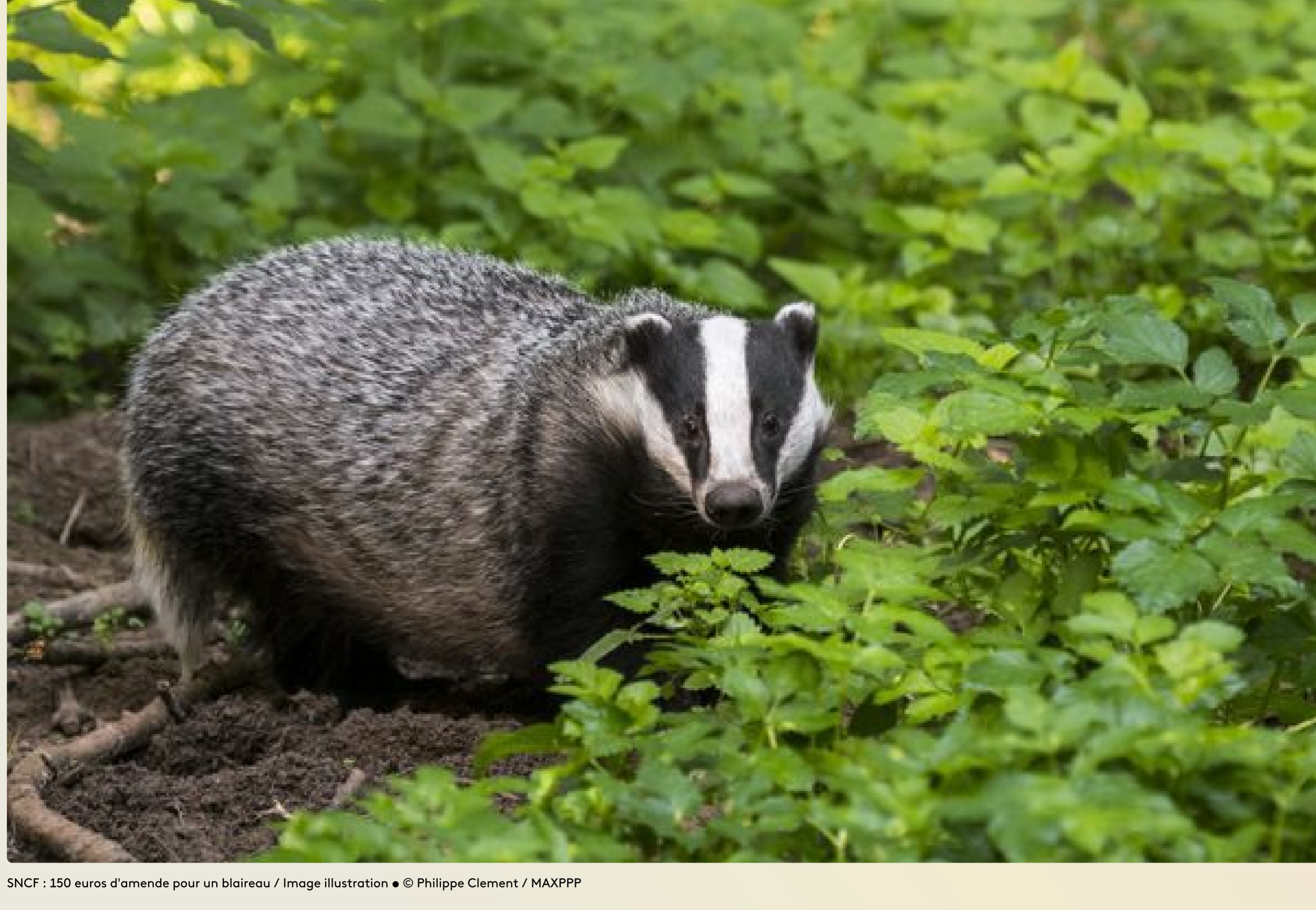
SNCF : 150 euros d'amende pour un blaireau / Image illustration • © Philippe Clement / MAXPPP

Publié le 30/06/2022 à 11h31 Mis à jour le 30/06/2022 à 17h46 Écrit par Karine Lepointeur