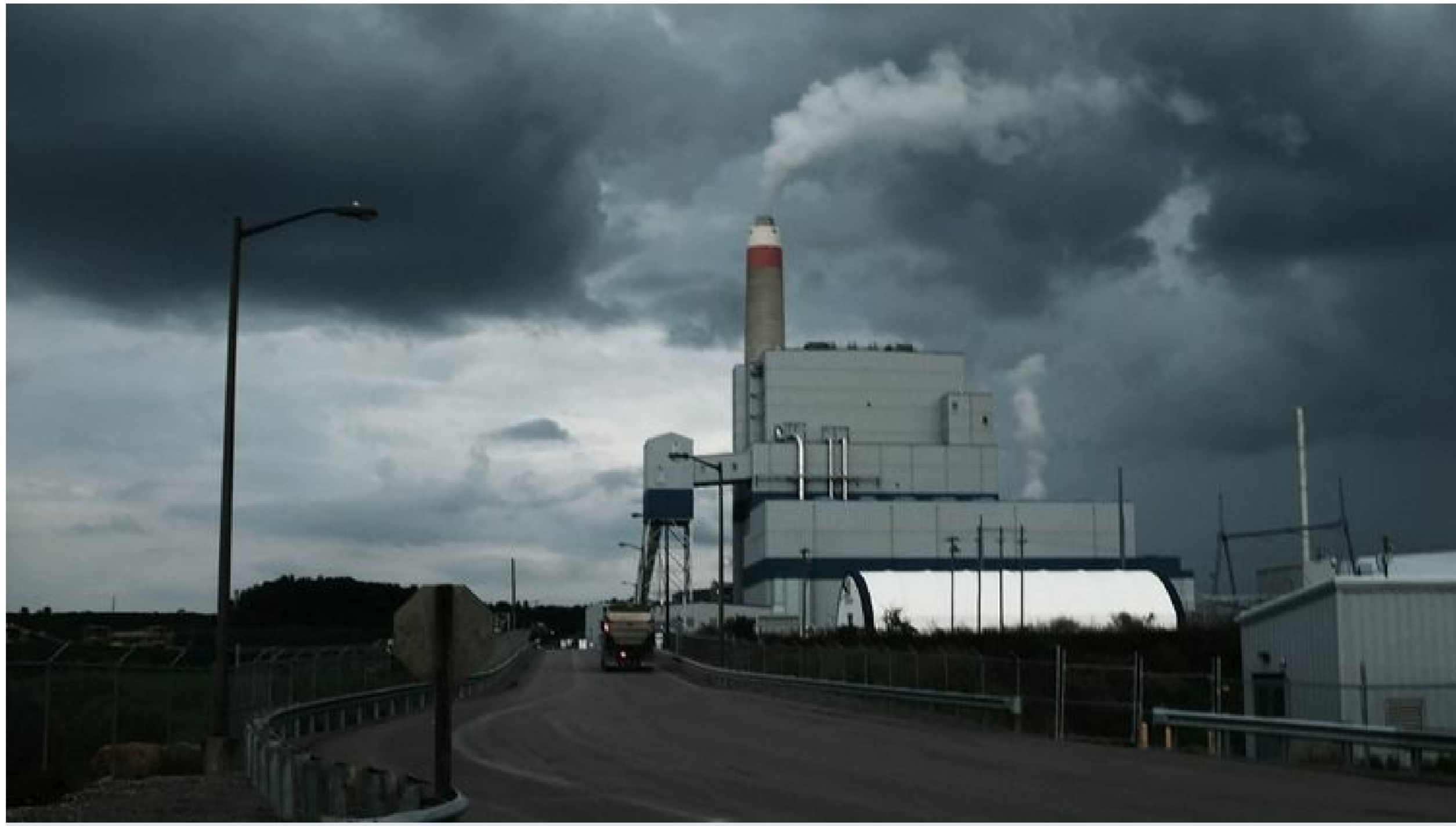
La centrale électrique de Longview, qui fonctionne au charbon, le 21 août 2018 à Madsville, en Virginie occidentale (Etats-Unis).

Cette décision pourrait avoir un lourd impact sur le réchauffement climatique. La plus haute juridiction des Etats-Unis a décidé, jeudi 30 juin, de limiter les moyens de l'Etat fédéral de lutter contre les gaz à effet de serre.