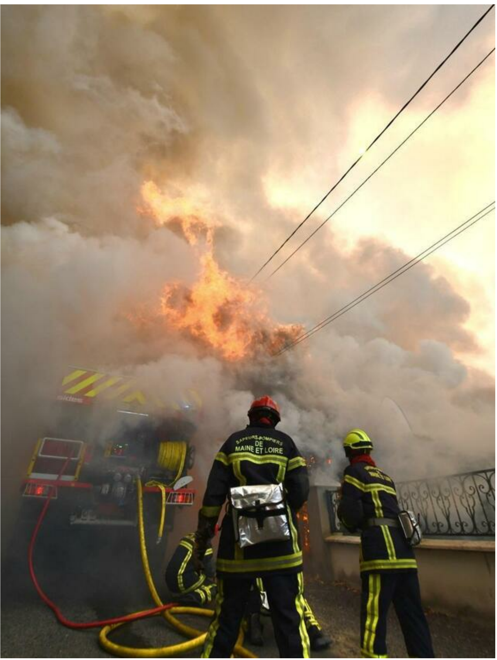
377 sapeurs-pompiers sont mobilisés contre l'incendie qui ravage le Baugeois.

Les propos du maire de Baugé-en-Anjou, qui s'est exprimé ce matin, vont dans le même sens. Ce dernier indique en effet que la propagation des flammes perd de la vitesse. « Le périmètre de l'incendie n'est pas encore fixé. On est à plus de 1200 hectares détruits. Globalement, le feu avance nettement moins vite qu'hier. Maintenant, l'évolution va dépendre du vent. C'est l'élément inquiétant. Les exploitations agricoles ont pu être épargnées jusqu'à ce matin. On attend de nouveaux avions qui vont permettre de sécuriser le site. Des pompiers de quinze ou seize départements sont mobilisés. Les habitants évacués ont été autorisés hier soir à aller chercher des effets dans leurs habitations. On cherche de nouvelles solutions pour les accueillir. Ils sont toujours hébergés au centre culturel. »