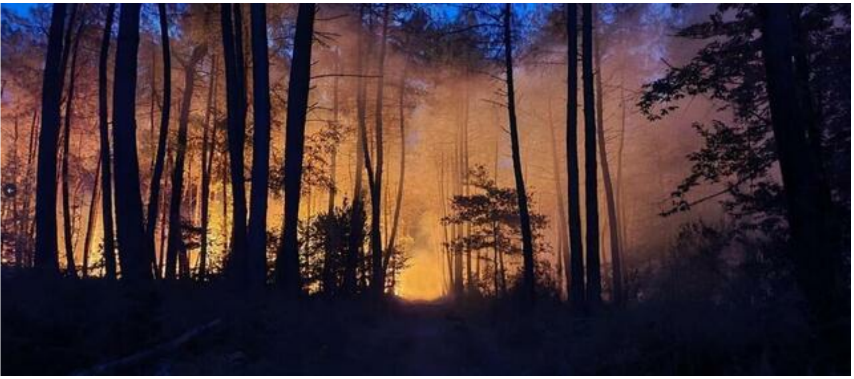
L'incendie du Baugeois a détruit 1240 hectares de forêt, selon le SDIS 49.