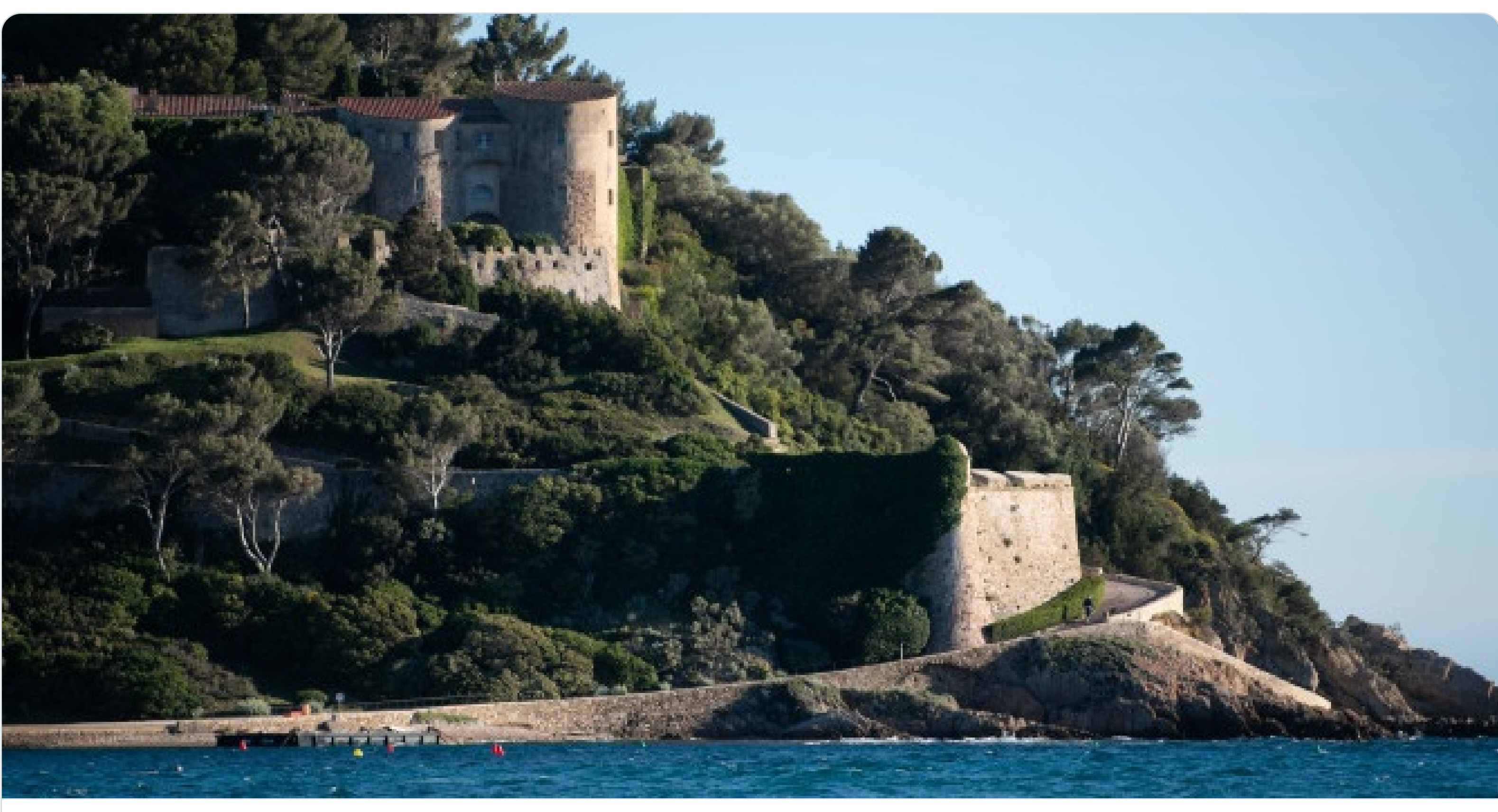
rtl.fr Emmanuel Macron taclé pour son utilisation d'un jet ski pendant ses vacances à Brégançon Une sortie du président de la République en mer continue de faire beaucoup de vagues chez les écologistes notamment qui appellent à un sursaut.