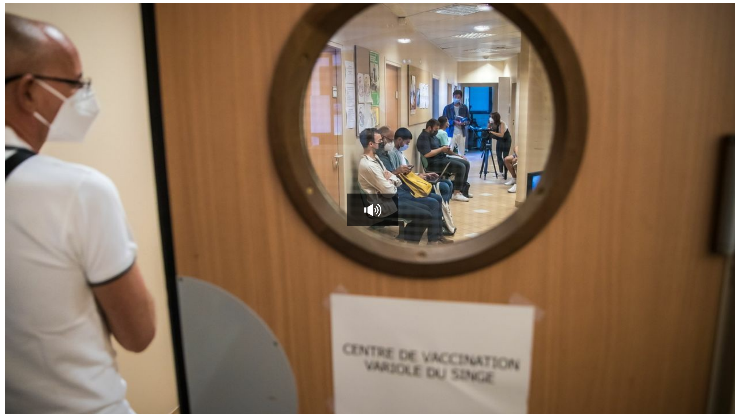
Variole du singe: des Suisses refoulés dans les centres de vaccination français / La Matinale / 1 min. / hier à 06:18

Alors que la Suisse tarde à autoriser des premiers vaccins contre la variole du singe, de nombreuses personnes cherchent à aller se faire vacciner à l'étranger. Mais en France, les centres de vaccination proches de Genève refusent de vacciner les Suisses, a appris la RTS.