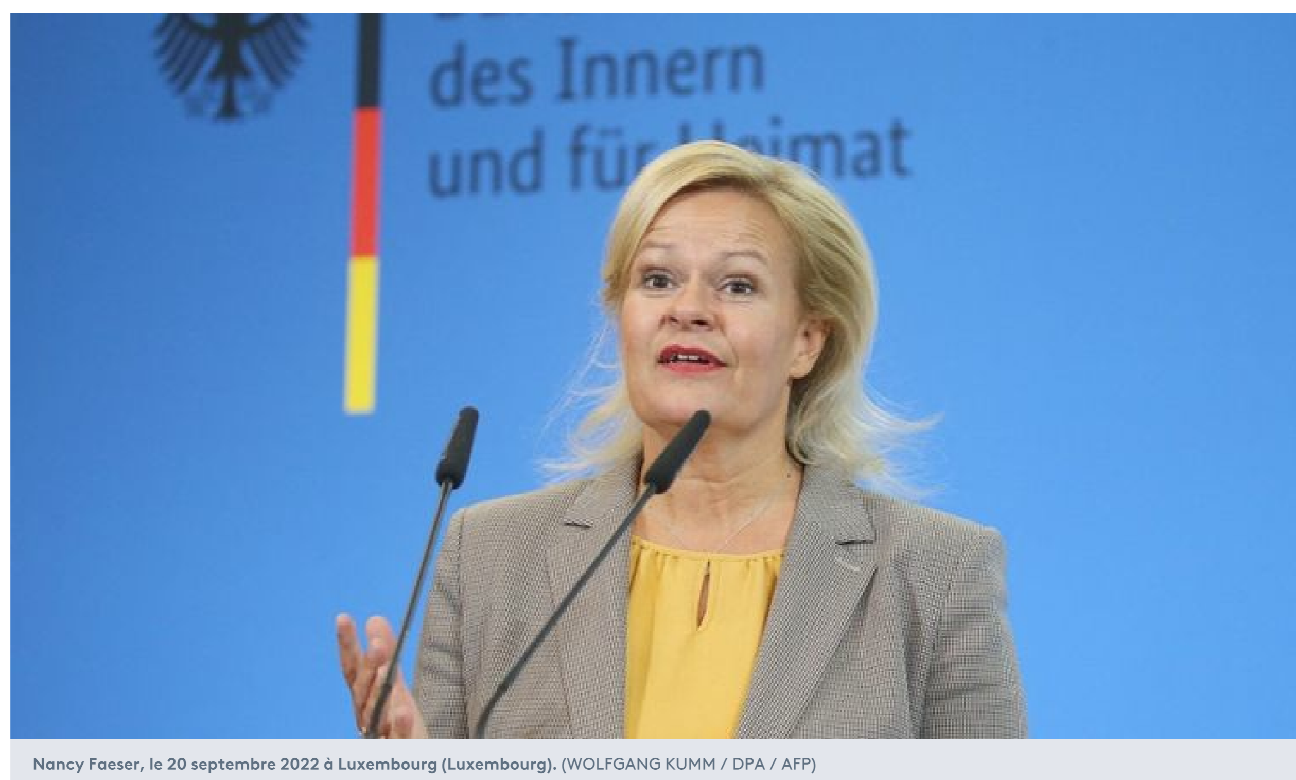
Nancy Faeser, le 20 septembre 2022 à Luxembourg (Luxembourg).

"Celui qui s'oppose courageusement à Poutine et se met ainsi en grand danger peut demander l'asile politique en Allemagne". La ministre allemande de l'Intérieur, Nancy Faeser, a déclaré jeudi 22 septembre, dans une interview au journal Frankfurter Allgemeine Zeitung , que le pays était prêt à accueillir les déserteurs de l'armée russe, estimant qu'ils sont "menacés de grave répression", après l'annonce par Vladimir Poutine de la mobilisation partielle de réservistes russes.