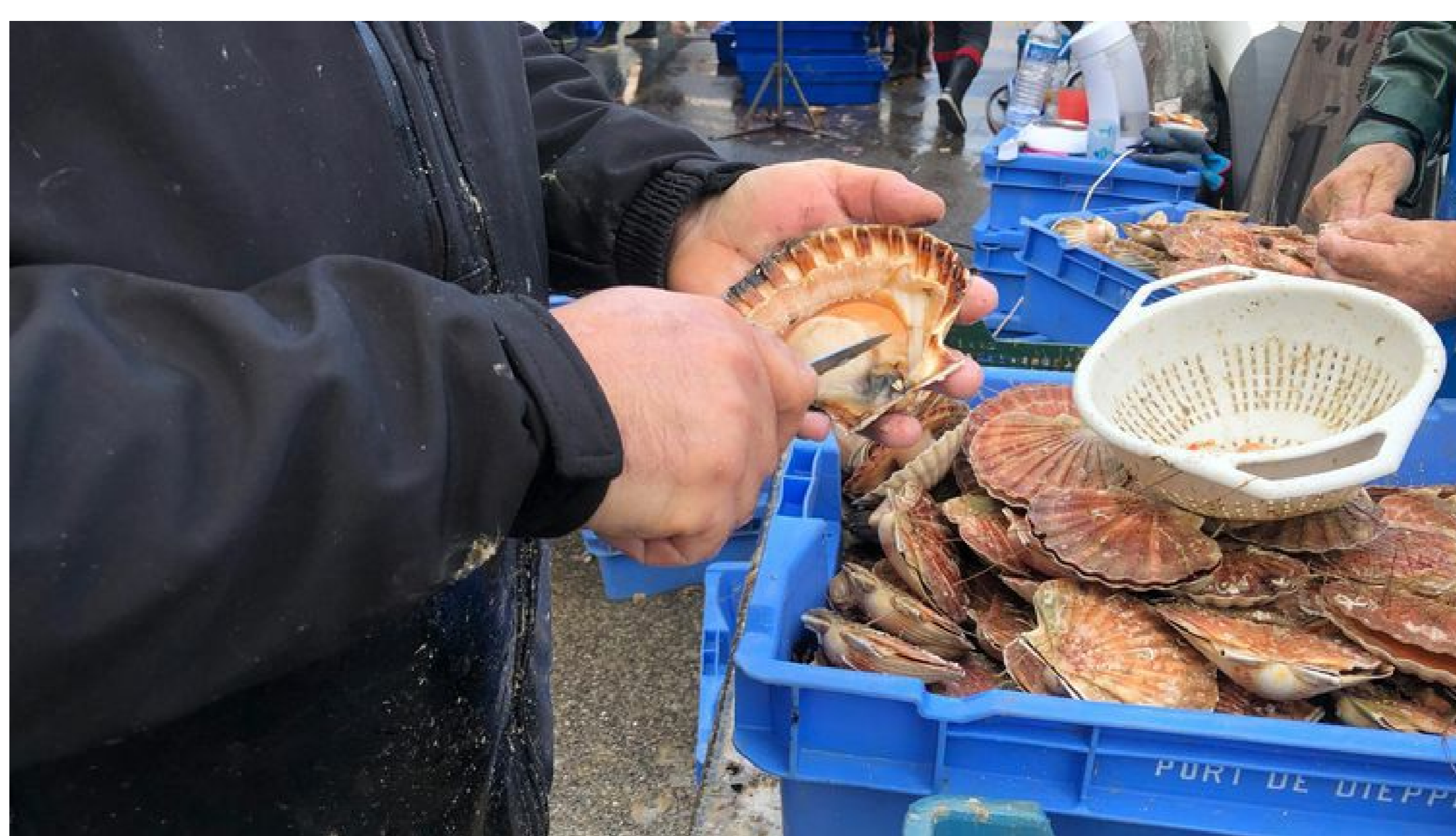
Coquille Saint-Jacques ouverte par un pêcheur à Dieppe (Seine-Maritime).

Les populations de coquilles Saint-Jacques ne se sont jamais aussi bien portées en France depuis 60 ans. D'après la toute dernière évaluation de l'Institut français de recherche pour l'exploitation de la mer (Ifremer), par rapport à l'année dernière (qui était déjà une année record), les stocks de coquilles Saint-Jacques de la Manche ont augmenté en biomasse : +31%, en baie de Seine et +13% en baie de Saint-Brieuc. Et cela, malgré la chaleur de cet été qui a pourtant diminué la production de phytoplancton dont se nourrissent les coquilles, et qui a donc entraîné chez elles un léger retard de croissance.