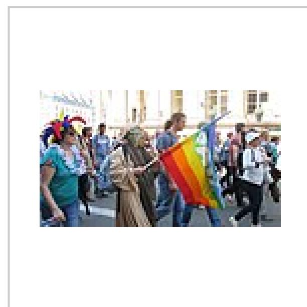
Manifestant (costumé en Yoda) avec le drapeau de la paix français.