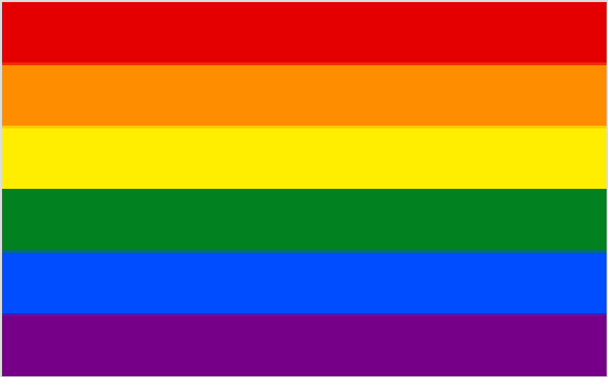
Drapeau arc-en-ciel LGBT.