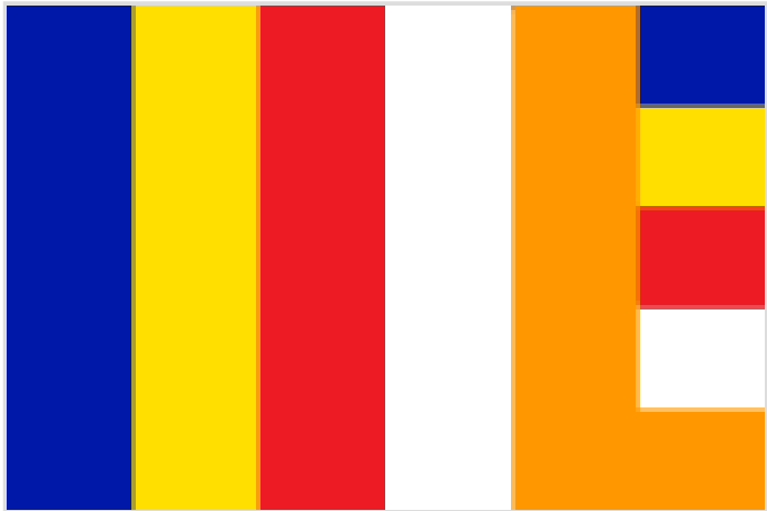
Le drapeau bouddhique.