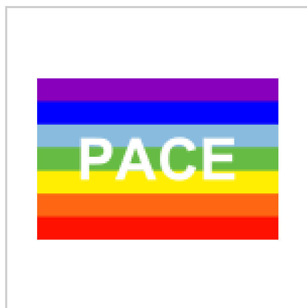
Drapeau de la paix italien ( Pace signifie « paix »).

Le plus souvent, le drapeau de la paix compte sept bandes de couleurs et porte le mot pace (« paix ») en blanc.