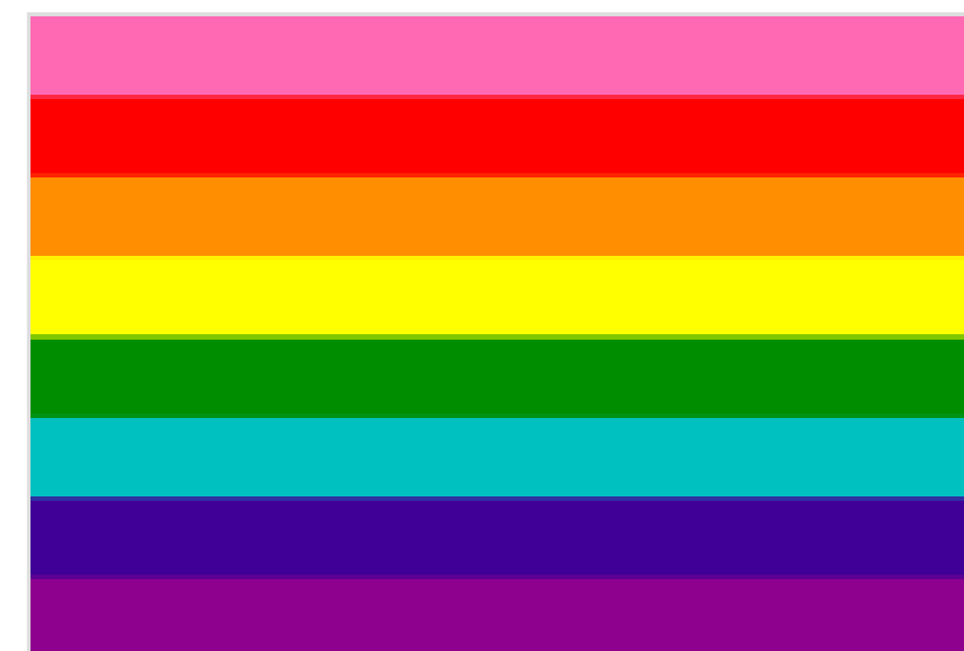
Drapeau originel à 8 couleurs.

De nos jours, ce drapeau est largement utilisé par les organisations du mouvement LGBT ainsi que par les commerces à destination d'un public LGBT . Le 17 juin 2015, le Museum of Modern Art (MoMA) de New York acquiert le premier drapeau arc-en-ciel 4,5 .