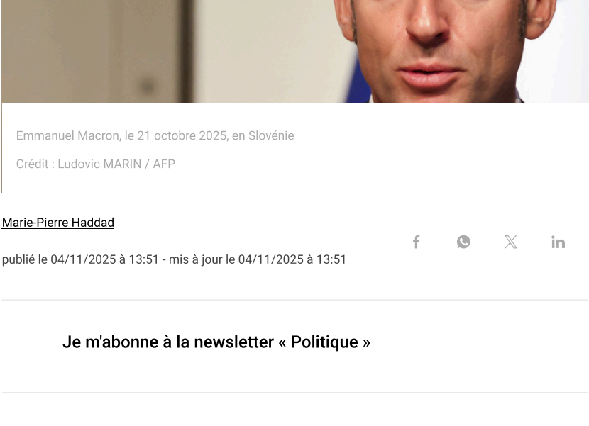
Emmanuel Macron, le 21 octobre 2025, en Slovénie

En déplacement à La Rochelle, le président de la République a prévu de débattre avec des jeunes de l'impact des réseaux sociaux sur leur vie quotidienne. Selon "Le Parisien", le président a promis à des proches : "Sur la politique nationale, je lâche le manche".