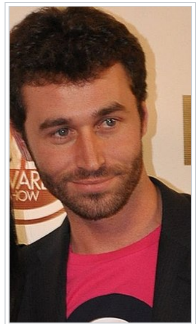
James Deen , exemple d'acteur X ayant tourné des scènes de « ass to mouth » 13 .

Cet acte sexuel est également présent dans la pornographie gay .