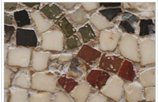
Abacules d'une mosaïque.