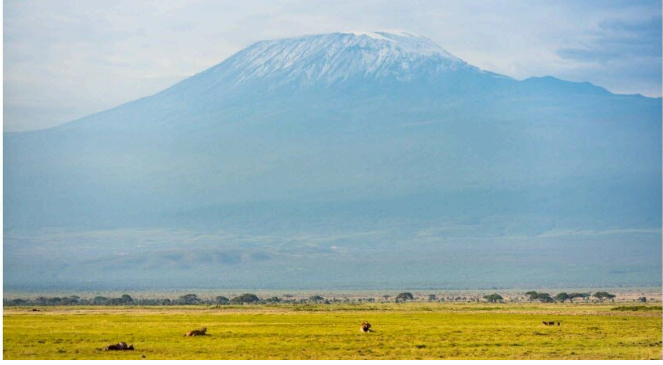
Le Kilimandjaro, plus haut sommet d'Afrique.

Un hélicoptère s'est écrasé mercredi sur le Kilimandjaro, plus haut sommet d'Afrique et haut lieu touristique de Tanzanie, tuant les cinq personnes à bord, dont deux touristes tchèques, ont annoncé jeudi les autorités tanzaniennes. L'accident s'est produit à environ 4 700 mètres d'altitude au niveau du camp de Barafu, selon l'autorité de l'aviation tanzanienne.