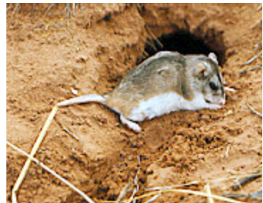
Souris sauterelle ou Onychomys du Nord