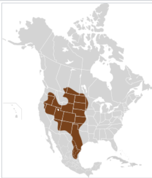
Carte de répartition.