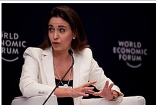
María Corina Machado au Forum économique mondial (2011).

En 2004, elle réunit trois millions de signatures demandant le départ d'Hugo Chávez, ce qui conduit au référendum révocatoire de 2004 (en), remporté par le président vénézuélien. En 2005, elle rencontre George W. Bush à la Maison-Blanche, les États-Unis étant déterminés à renverser le régime chaviste 7 . Elle est ensuite accusée avec d'autres représentants de l'association Súmate de trahison pour avoir reçu des fonds de la part du National Endowment for Democracy (NED), une organisation américaine promouvant la démocratie libérale, et subit une interdiction de sortie du territoire 8 . Ces fonds (31 150 US $) étaient destinés à favoriser la destitution du président Hugo Chávez lors du référendum 9 . Des menaces de mort sont proférées à l'encontre de sa famille, aussi envoie-t-elle ses enfants encore très jeunes chez sa mère qui vit aux États-Unis 8 .