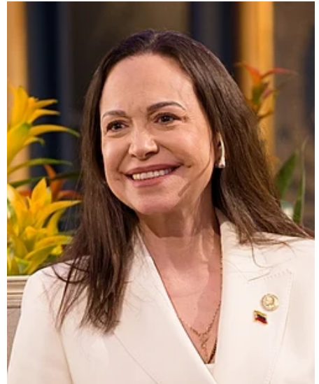
María Corina Machado en 2025.