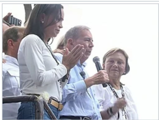
Maria Corina Machado (à gauche) et Edmundo González Urrutia (2024).

Elle milite pour le boycott de l'élection présidentielle vénézuélienne de 2018, estimant que la participation aux élections tendait à légitimer un pouvoir autoritaire, et qualifie de « répugnante et indigne » la démarche de conciliation du candidat de l'opposition Henri Falcón 14 . À partir de 2019, elle soutient activement Juan Guaidó pour son accession à la présidence du Venezuela 8 .