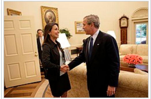
George W. Bush accueille María Corina Machado dans le Bureau ovale, le 31 mai 2005.

En février 2010, elle quitte son poste à Súmate et annonce sa candidature à l'Assemblée nationale du Venezuela. Elle est élue députée en 2010 dans la deuxième circonscription de l'État de Miranda 10 . Le 13 janvier 2012, à l'Assemblée nationale et en direct à la télévision nationale, María Corina Machado lance une Rendición contre Chávez et le traite directement de voleur 8 , affirmant que « exproprier, c'est voler » 11 . Lors des primaires de l'opposition de 2012, elle remporte 3,81 % des voix contre 64,33 % pour son adversaire Henrique Capriles 11 . En 2012, son suppléant se retire de la Table de l'unité démocratique (MUD), coalition de