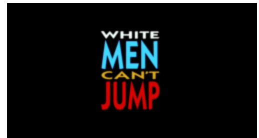
Carton-titre original du film.