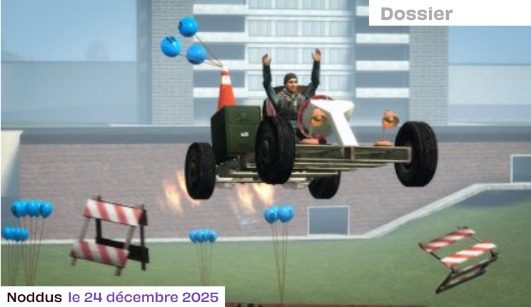
Noddus le 24 décembre 2025