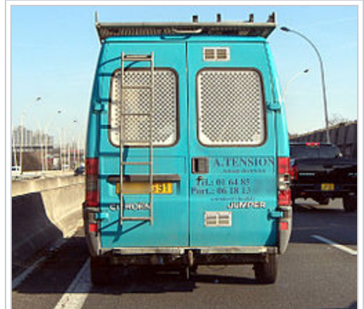
A. Tension, aptonyme d'un électricien basé sur le nom de famille.