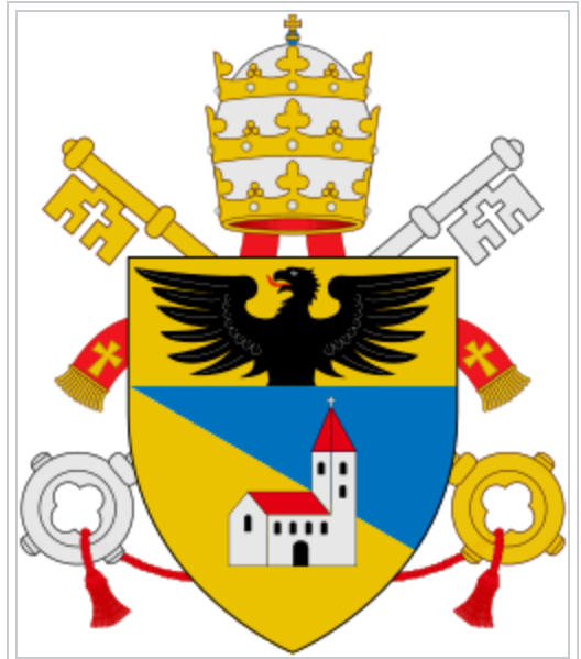
Armoiries parlantes du pape Benoît XV , né Giacomo della Chiesa (« de l'Église »).