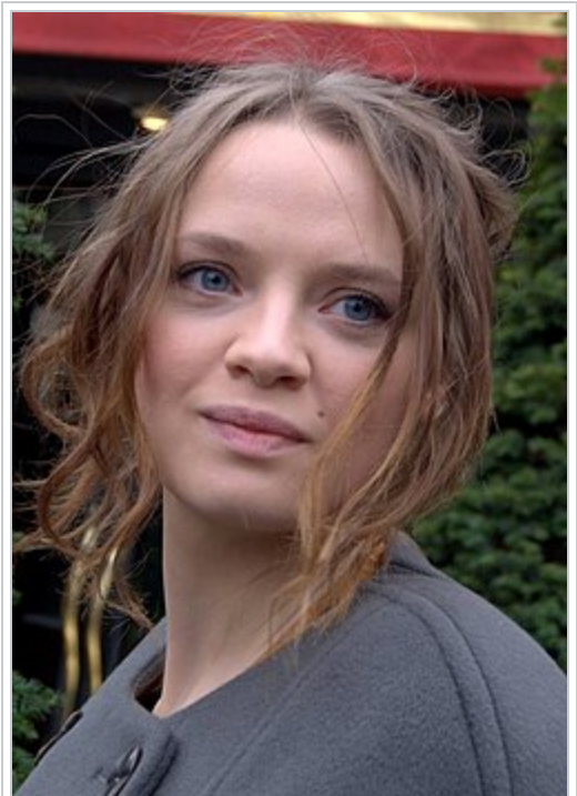
L'actrice principale Sara Forestier au déjeuner des nommés des César 2011 .