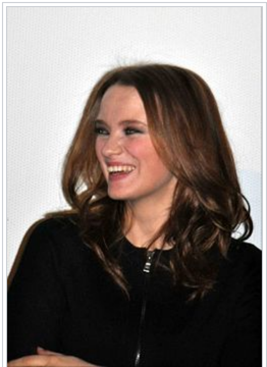
L'actrice principale Sara Forestier , lors d'une avant-première du film.