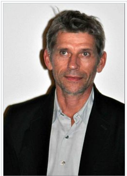
L'acteur principal Jacques Gamblin , lors d'une avant-première du film.

Le réalisateur de film d'animation Serge Éliassalde est l'auteur des dessins exécutés par le personnage du père de Bahia lorsqu'il est enfant en Algérie.