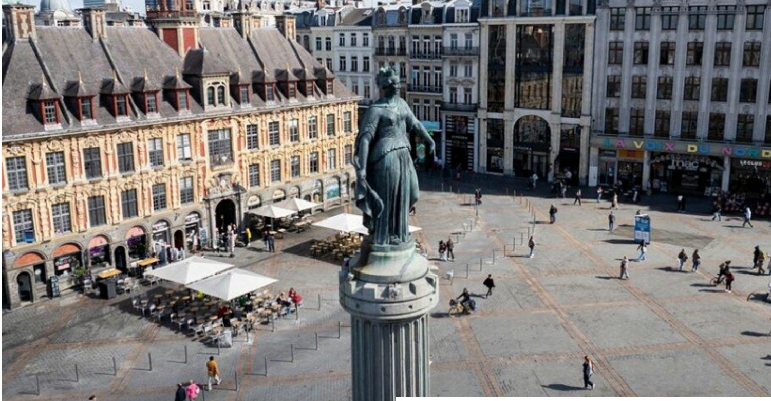
Grand'Place de Lille piétonne depuis le 12 janvier 2026.

La Grand'Place de Lille est piétonne depuis le 12 janvier 2026. Voici toutes les infos à retenir.