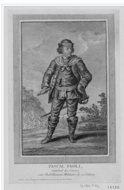
portrait de Pascal Paoli général des corses 1725-1807