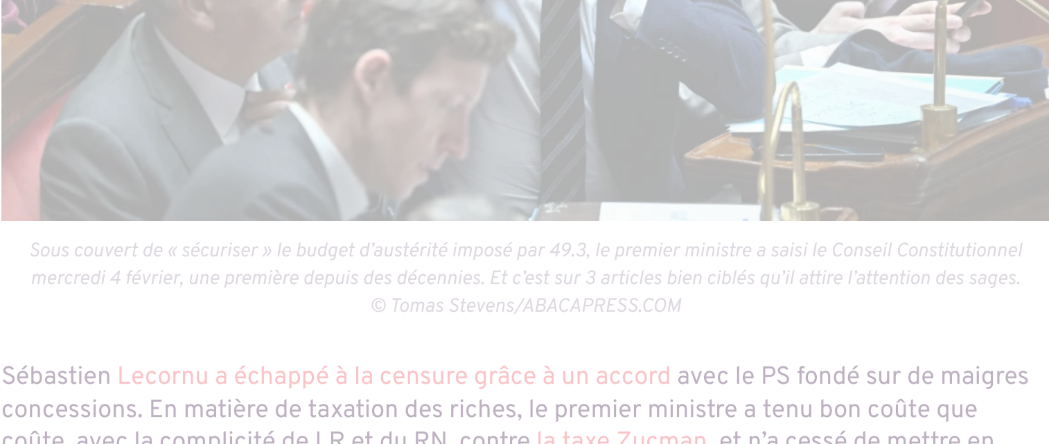
Sous couvert de « sécuriser » le budget d'austérité imposé par 49.3, le premier ministre a saisi le Conseil Constitutionnel mercredi 4 février, une première depuis des décennies. Et c'est sur 3 articles bien ciblés qu'il attire l'attention des sages.