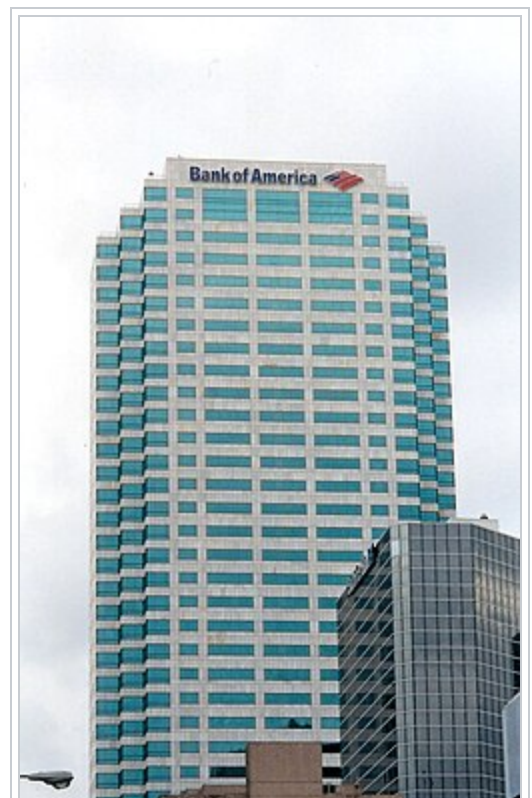
Vue du bâtiment visé, sept ans plus