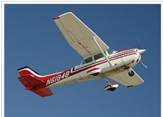
Un Cessna 172 , du même modèle que celui qui a été utilisé pour l'attentat.