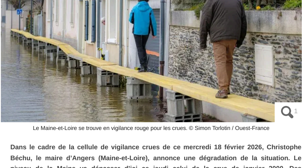
Le Maine-et-Loire se trouve en vigilance rouge pour les crues.

Dans le cadre de la cellule de vigilance crues de ce mercredi 18 février 2026, Christophe Béchu, le maire d'Angers (Maine-et-Loire), annonce une dégradation de la situation. Le niveau de la Maine va dépasser d'ici ce jeudi celui de la crue de janvier 2000. Des conséquences sont attendues sur le bas de la ville.