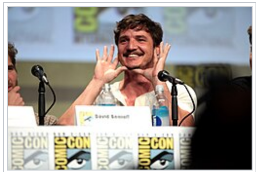
Pedro Pascal à la San Diego Comic-Con en 2014.

L'année suivante, il joue un vampire dans le film Bloodsucking Bastards , puis l'amant de Heidi Klum dans le clip vidéo Fire Meet Gasoline de la chanteuse australienne Sia 28,29 . Sa reconnaissance est confirmée grâce à son interprétation de l'agent de la DEA Javier Peña dans la série télévisée Narcos , produite par Netflix , où il fait office de narrateur et d'acteur principal 30,31 .