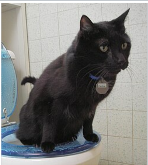
Chat dressé à utiliser des toilettes humaines