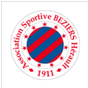
Logo dans les années 1990.