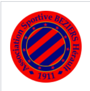
Logo dans les années 2000.