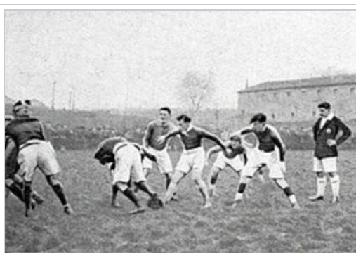
Mars 1919, victoire de l'AS biterroise face au Stade toulousain , en quart de finale de la Coupe de l'Espérance (3-0).

Disparue au commencement de la Première Guerre mondiale , en 1914, l'AS Béziers renaît à la suite d'une nouvelle fusion de deux équipes créées par des adolescents au début du conflit mondial : celles de la Jeunesse sportive et du Midi sportif en 1916 3,7 .