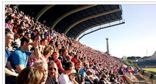
Les travées du stade Raoul-Barrière un jour de match de Pro D2 .

En 1922, Louis Viennet investit vingt mille francs-or et avec d'autres personnes, dont Jules Cadenat et des représentants de la Compagnie du Midi , qui investissent pour un total de deux cent mille francs, le club acquiert le terrain de Sauclières où les installations sportives sont développées 2,9,113,112 .