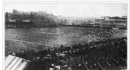
Demi-finale du championnat perdue face au Stade toulousain, en avril 1924, à Carcassonne derrière les vignobles (fond à G., le château ).

À jamais les premiers vainqueurs de la Coupe d'Europe 1962 [ modifier | modifier le code ]