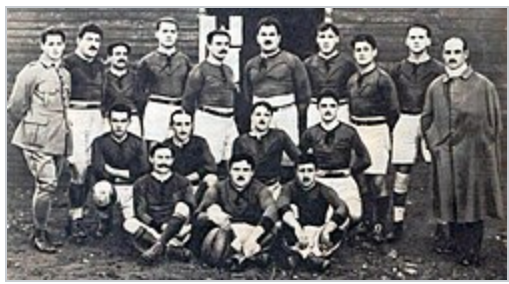
L'AS Biterroise en décembre 1920.

De plus, la guerre ayant perturbé la société française, l' Union des sociétés françaises de sports athlétiques (USFSA), l'organisme régissant tous les sports, avait décidé d'organiser la Coupe de l'Espérance pour remplacer le Championnat de France. Durant la saison 1918-1919, l'AS Béziers joue donc la Coupe de l'Espérance mais s'incline 25 à 5 contre le Stadoceste tarbais en demi-finale 13 , la première de son histoire 10 .