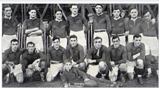
L'AS Biterroise en juin 1927.

La saison suivante, le club dispute sa première demi-finale de Championnat de France en 1924 16 .