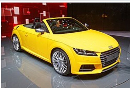
Audi TTS 8S Roadster

L'Audi TTS reçoit le 4-cylindres en ligne 2 litres poussé à 310 ch.