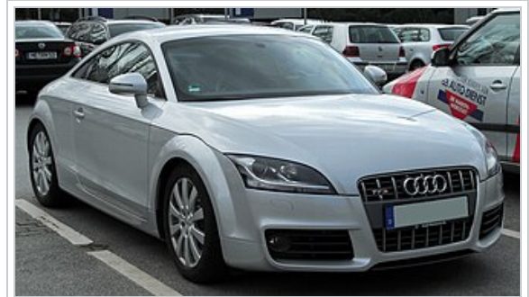
Audi TT (8J) 2 e génération.

L' Audi TT est un coupé 2+2 , également disponible en roadster , du constructeur automobile allemand Audi , produite du 18 février 1998 au 10 novembre 2023 1 à 662 762 exemplaires en trois générations 2 . Le nom de TT provient du modèle NSU Prinz TT (La marque NSU a été absorbée par Audi en 1977). Le nom TT signifie Tourist Trophy .