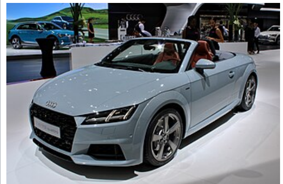
Audi TT Roadster 45 TFSI quattro