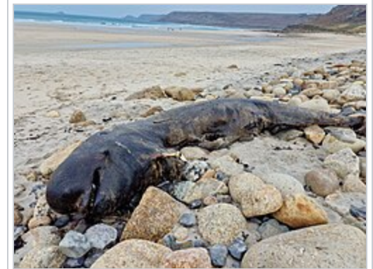
Globicéphale échoué sur la plage de Sennen en Cornouailles, Angleterre