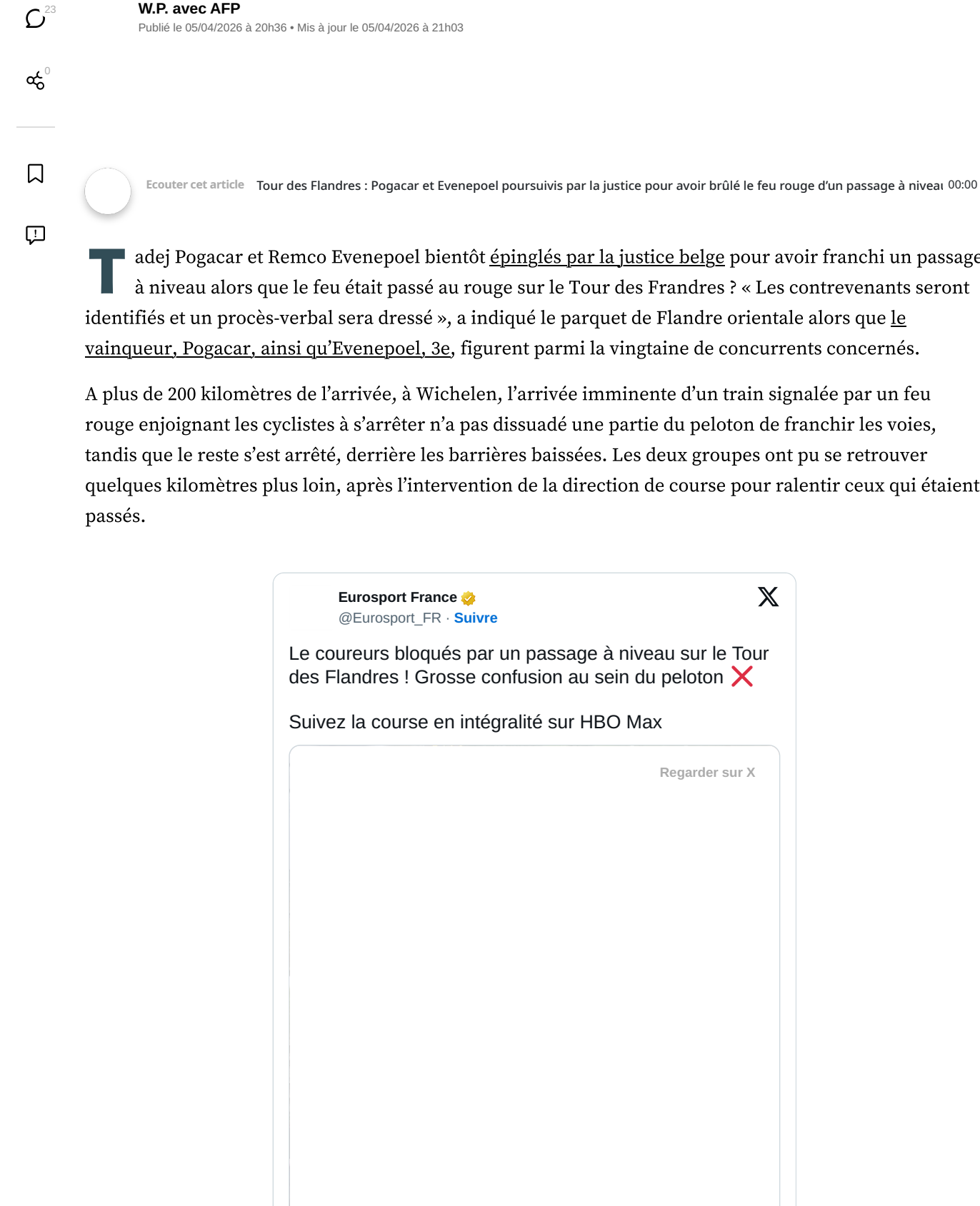
Le passage d'un train sur le Tour des Flandres a scindé le peloton. Certains coureurs à l'avant, dont Pogacar et Evenepoel, étaient passés au rouge. - Capture d'écran

CODE DE LA ROUTE - Tadej Pogacar, Remco Evenepoel et les autres coureurs qui ont franchi un passage à niveau alors que le feu était passé au rouge seront poursuivis par la justice belge