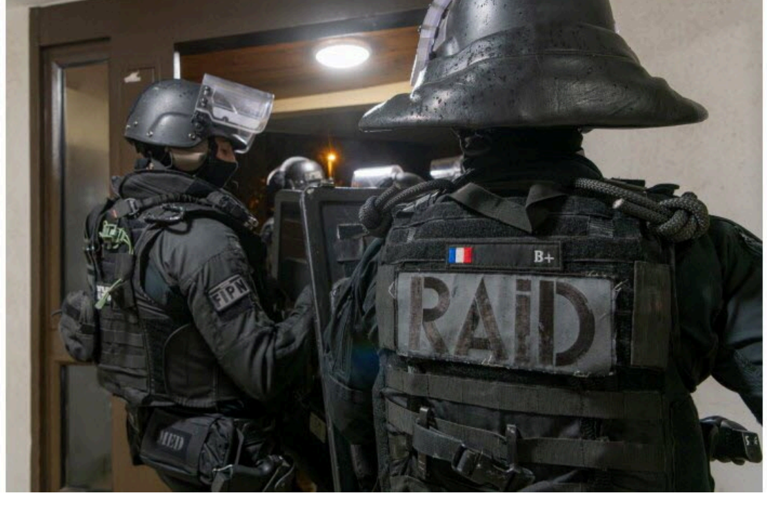
Le Raid est intervenu vendredi au domicile du Strasbourgeois.

Il a expliqué avoir voulu « tester la fiabilité et la surveillance de l'intelligence artificielle » et a été servi !