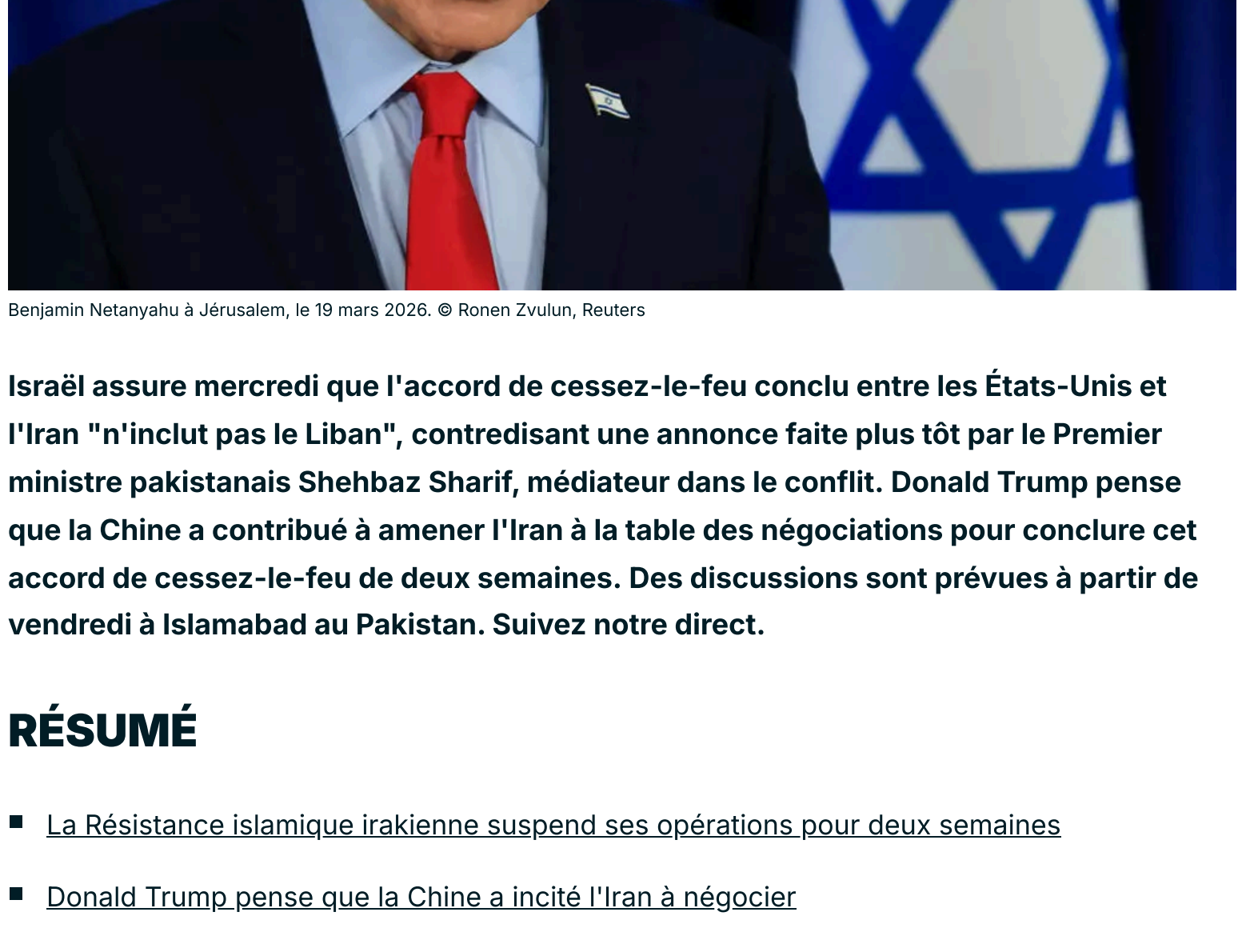
Benjamin Netanyahu à Jérusalem, le 19 mars 2026.

Israël assure mercredi que l'accord de cessez-le-feu conclu entre les États-Unis et l'Iran "n'inclut pas le Liban", contredisant une annonce faite plus tôt par le Premier ministre pakistanais Shehbaz Sharif, médiateur dans le conflit. Donald Trump pense que la Chine a contribué à amener l'Iran à la table des négociations pour conclure cet accord de cessez-le-feu de deux semaines. Des discussions sont prévues à partir de vendredi à Islamabad au Pakistan. Suivez notre direct.