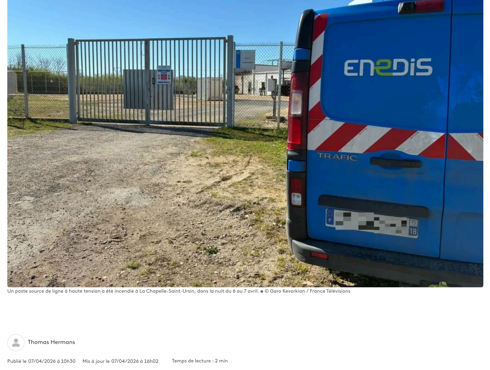
Un poste source de ligne à haute tension a été incendié à La Chapelle-Saint-Ursin, dans la nuit du 6 au 7 avril.