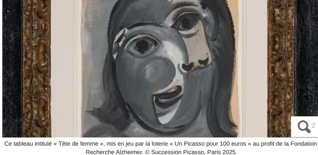
Ce tableau intitulé « Tête de femme », mis en jeu par la loterie « Un Picasso pour 100 euros » au profit de la Fondation Recherche Alzheimer. © Succession Picasso, Paris 2025