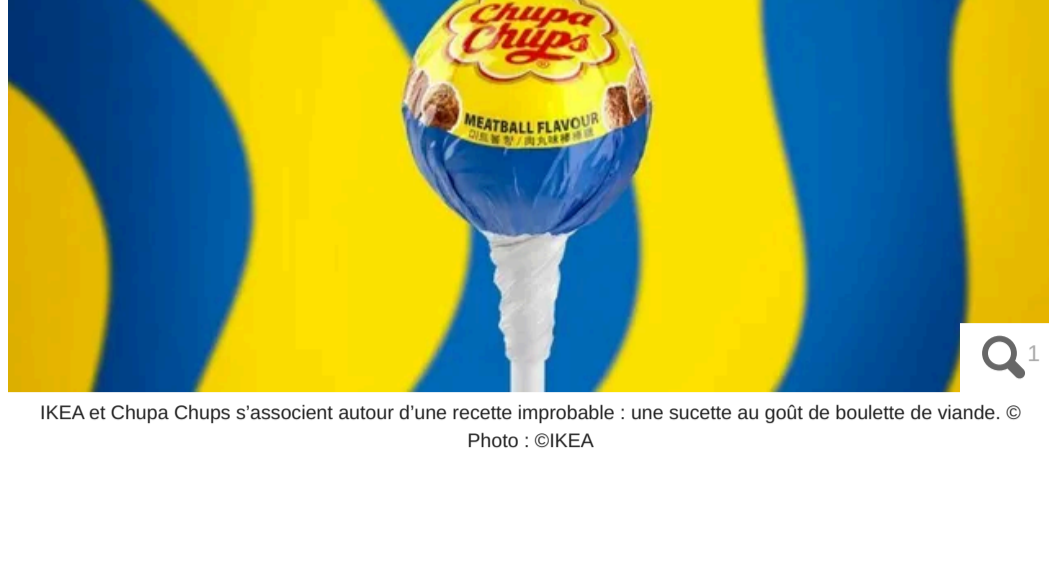
IKEA et Chupa Chups s'associent autour d'une recette improbable : une sucette au goût de boulette de viande.