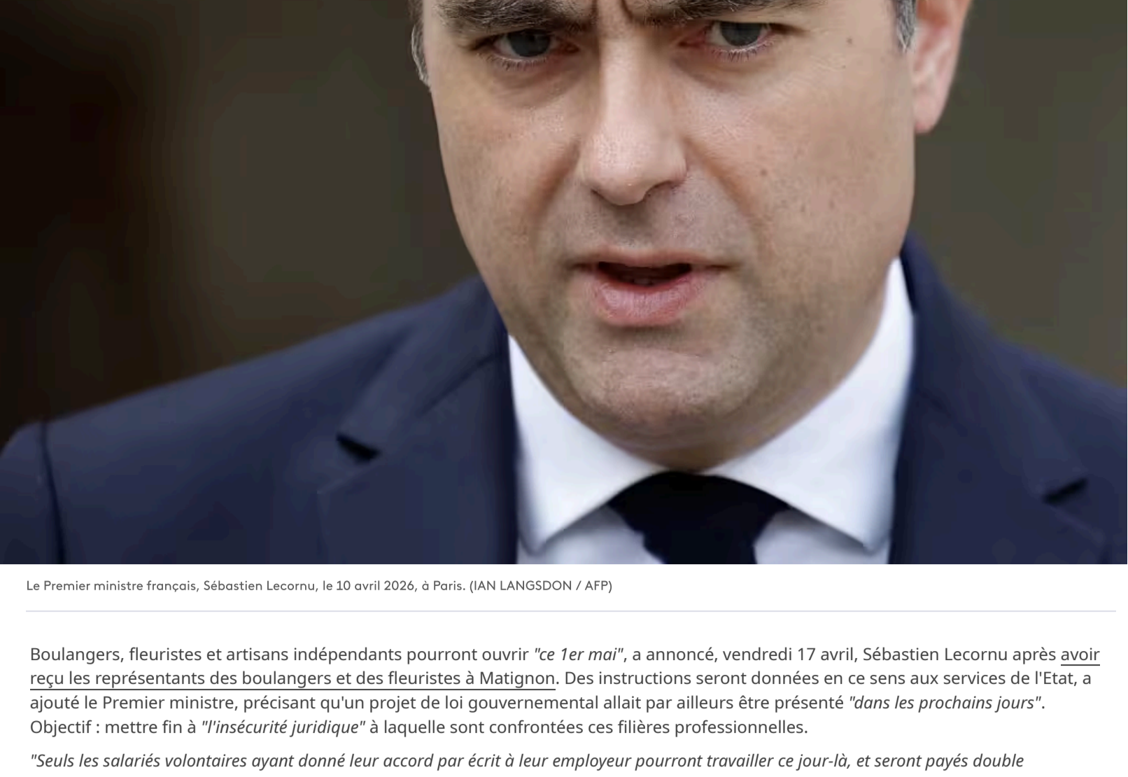
Le Premier ministre français, Sébastien Lecornu, le 10 avril 2026, à Paris.

Publié le 17/04/2026 14:58 Mis à jour il y a 23 minutes Temps de lecture : 1min