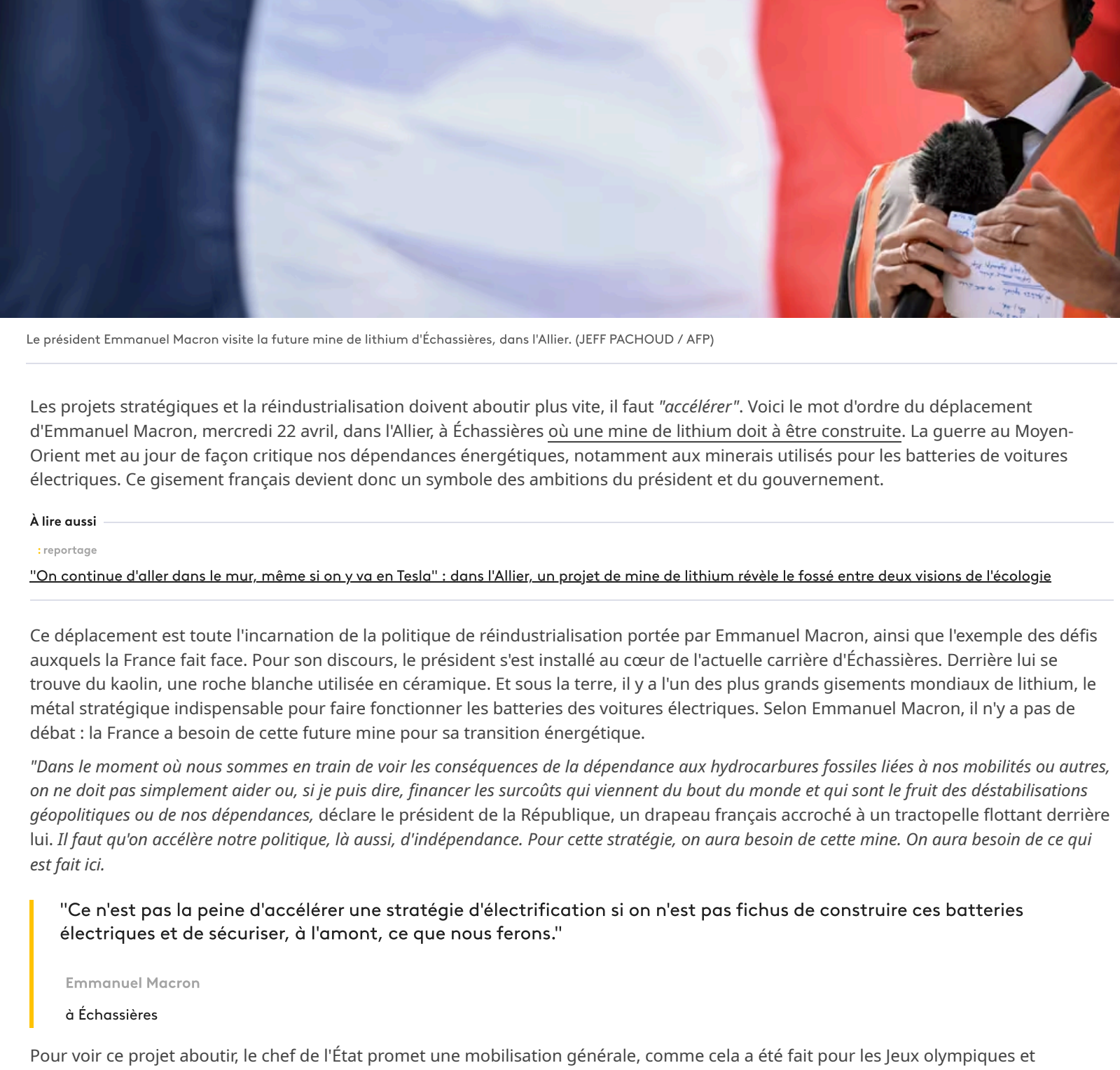
Le président Emmanuel Macron visite la future mine de lithium d'Échassières, dans l'Allier.

Publié le 22/04/2026 17:45 Temps de lecture : 4min