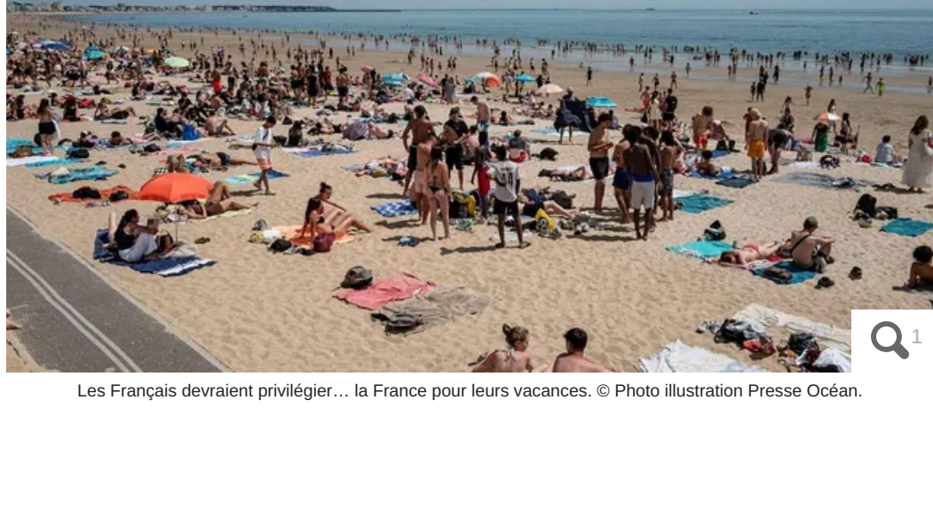
Les Français devraient privilégier... la France pour leurs vacances.