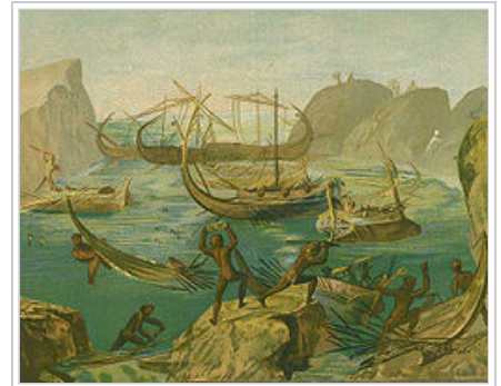
Destruction des nefs d' Ulysse par les Lestrygons, panneau peint d'époque romaine (v. 40-60), musée du Vatican

Selon Homère, le port de Télépyle est « bien connu des navigateurs », or, dès le x e siècle av. J.-C. , les navigateurs grecs commerçaient avec le peuple des Tyrrhéniens , important du minerai de plomb, d'argent ou de cuivre de l' île d'Elbe et de la Sardaigne 6 , et ont pu y faire escale. Chez les Lestrygons, peuple de pasteurs, Homère dit que « le berger appelle le berger », ce qui est l'indice culturel bien connu de ces longs appels modulés que lancent en alternance les gardiens de troupeaux, en Corse et en Sardaigne, lorsqu'ils font mouvement. Que « les chemins du jour avoisinent ceux de la nuit », peut être interprété comme une allusion à la longueur des journées estivales par rapport aux nuits, dans les confins septentrionaux de la Méditerranée occidentale tels que se les représentaient les navigateurs grecs entre le viii e et le vi e siècle av. J.-C. Sur la base de ces constats, Victor Bérard 1 , comme Jean Cuisenier situe donc Télépyle sur la côte sarde , précisément au fond du bras de mer de Porto Pozzo, « le Port du Puits », à l'ouest des îles actuelles de La Maddalena , entre la pointe Monte Rosso et la pointe delle Vacche. L'adéquation