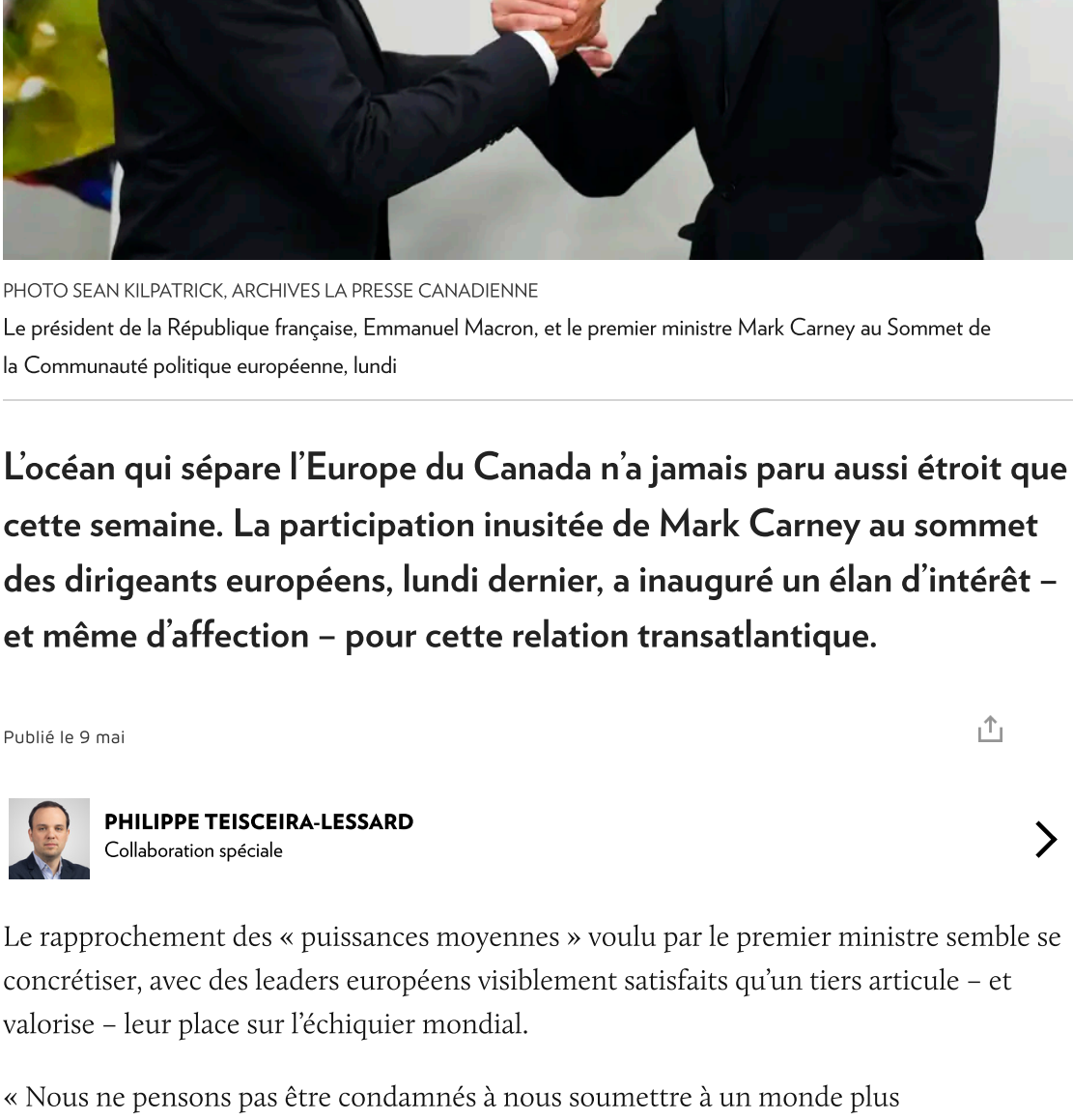
Le président de la République française, Emmanuel Macron, et le premier ministre Mark Carney au Sommet de la Communauté politique européenne, lundi

L'océan qui sépare l'Europe du Canada n'a jamais paru aussi étroit que cette semaine. La participation inusitée de Mark Carney au sommet des dirigeants européens, lundi dernier, a inauguré un élan d'intérêt – et même d'affection – pour cette relation transatlantique.