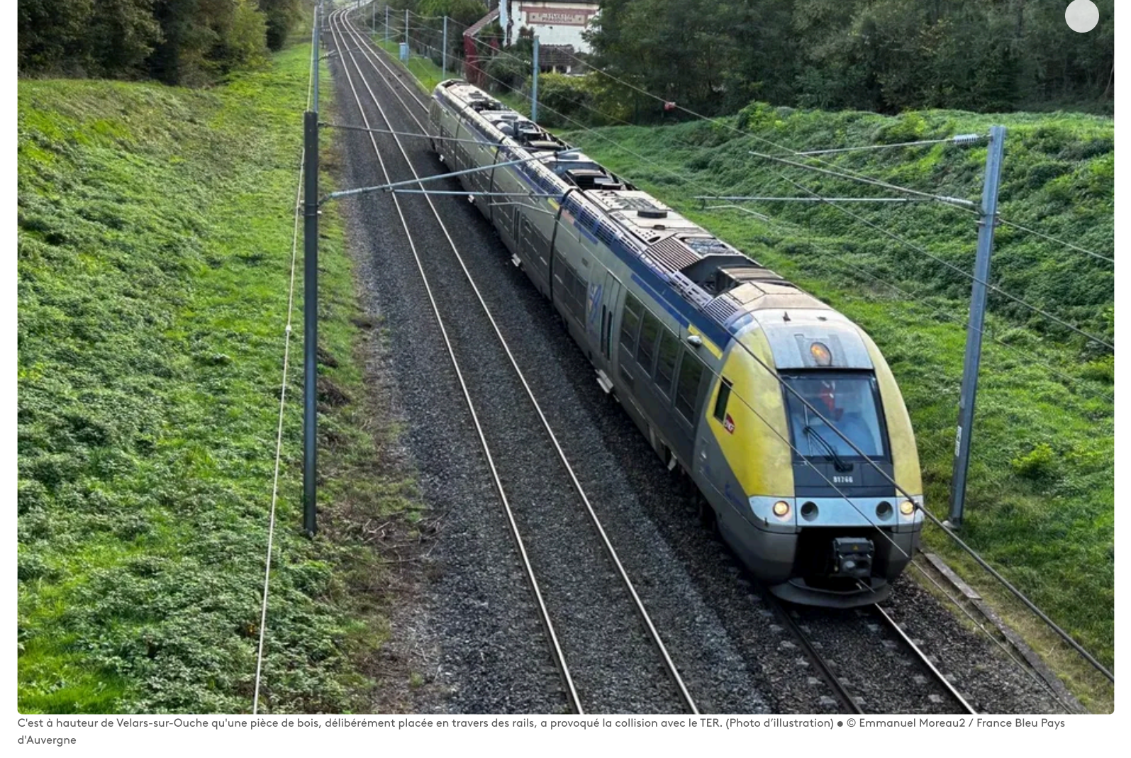
C'est à hauteur de Velars-sur-Ouche qu'une pièce de bois, délibérément placée en travers des rails, a provoqué la collision avec le TER. (Photo d'illustration)