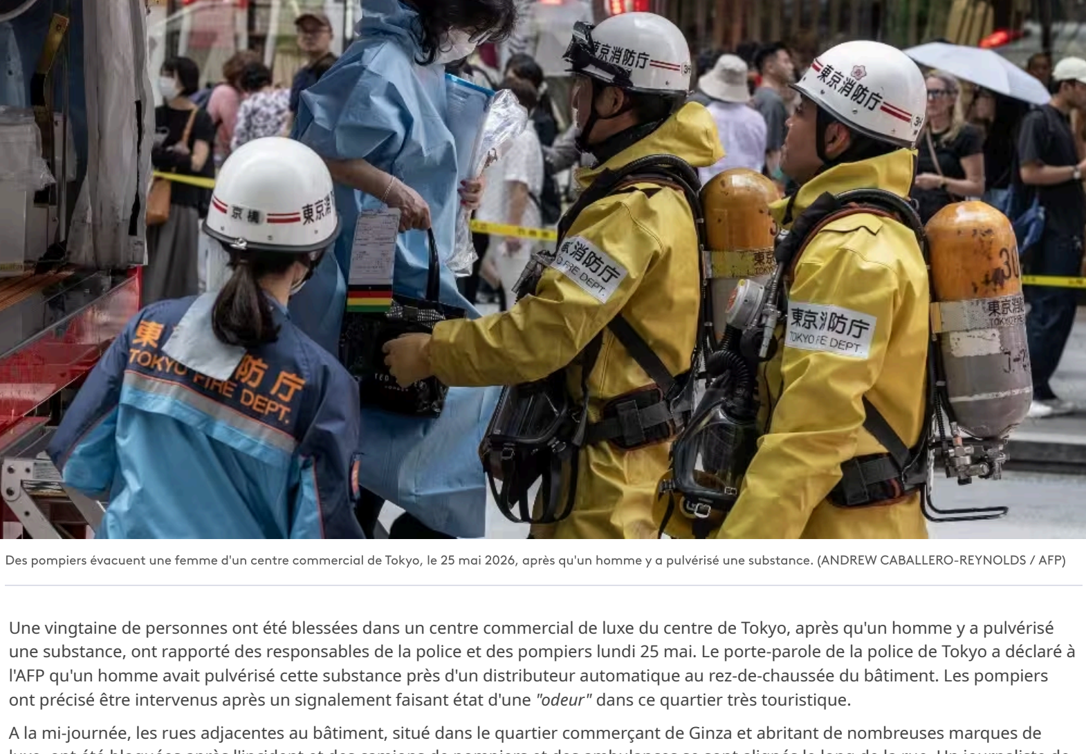
Des pompiers évacuent une femme d'un centre commercial de Tokyo, le 25 mai 2026, après qu'un homme y a pulvérisé une substance.

Publié le 25/05/2026 10:40 Mis à jour le 25/05/2026 10:43 Temps de lecture : 1min