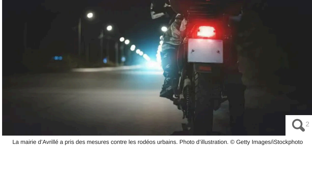
La mairie d'Avrillé a pris des mesures contre les rodéos urbains. Photo d'illustration.