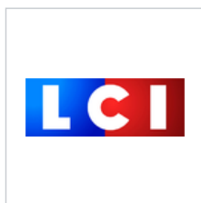
Logo du 2 janvier 2012 au 1 er janvier 2016.