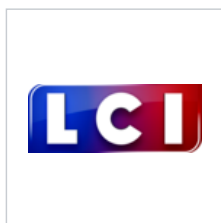
Logo du 1 er janvier 2016 au 28 août 2017.