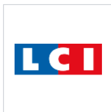
Logo du 24 juin 1994 au 2 janvier 2012.