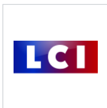
Logo depuis le 28 août 2017.