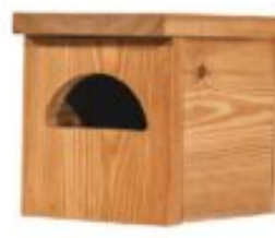
Nestkast Zwarte roodstaart €29,00