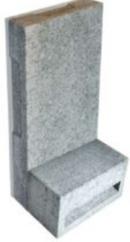
Enkele inbouwsteen voor vleermuizen met entresteen €63,00