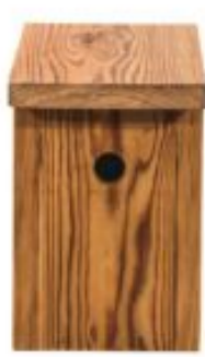
Nestkast Pimpelmees €29,00