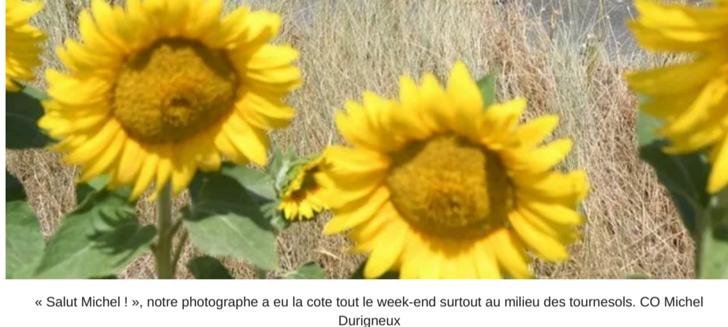
Une idée de génie assurément, sauf quand le soleil est face... CO Michel Durigneux

> À LIRE AUSSI | Anjou Vélo Vintage : première réussite pour le nouveau parcours de 38 km « Les sœurs La Sonnette »