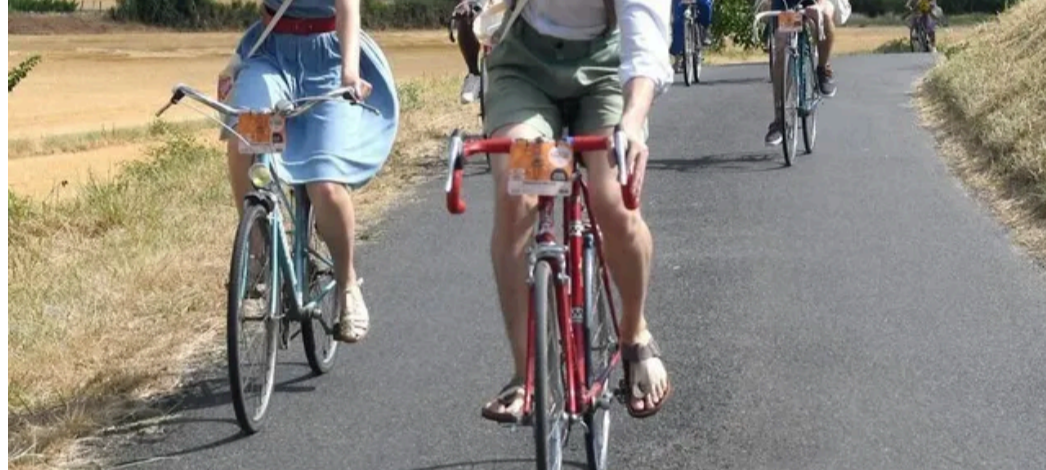
AVV, c'est le plaisir d'avaler des kilomètres sur des vieux vélos, entre amis ou en famille. CO Michel Durigneux