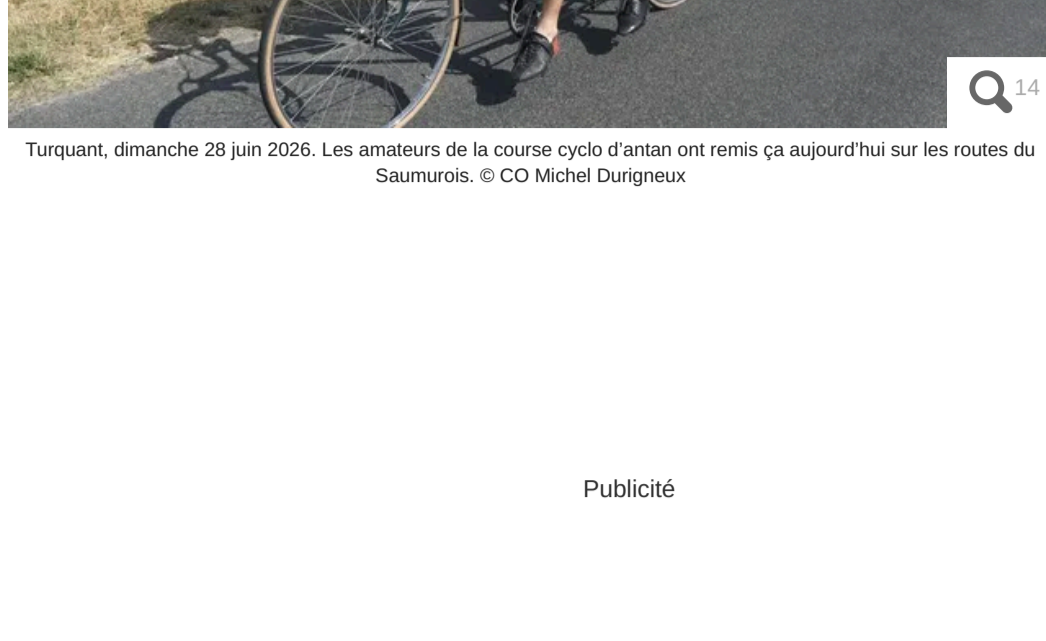
Turquant, dimanche 28 juin 2026. Les amateurs de la course cyclo d'antan ont remis ça aujourd'hui sur les routes du Saumurois.