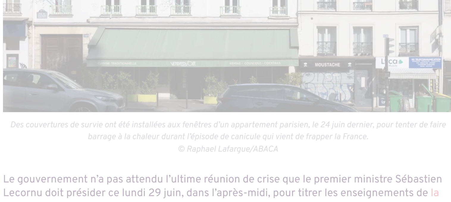
Des couvertures de survie ont été installées aux fenêtres d'un appartement parisien, le 24 juin dernier, pour tenter de faire barrage à la chaleur durant l'épisode de canicule qui vient de frapper la France.

Le gouvernement n'a pas attendu l'ultime réunion de crise que le premier ministre Sébastien Lecornu doit présider ce lundi 29 juin, dans l'après-midi, pour tirer les enseignements de la canicule qui vient de frapper la France avec un lourd bilan. Il taille déjà, à contresens, dans les aides à la rénovation énergétique qui participent à la fois à la lutte contre le réchauffement climatique et à l'adaptation. Le ministère du Logement a ainsi confirmé dimanche 28 juin à l'AFP que la liste des travaux éligibles à MaPrimeRénov' allait de nouveau être révisée à la baisse. Première victime : les travaux d'isolation.