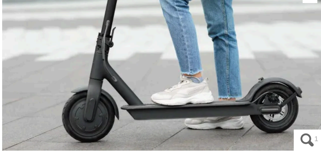
La circulation des trottinettes électriques sera désormais interdite en centre-ville, dans les rues piétonnes.