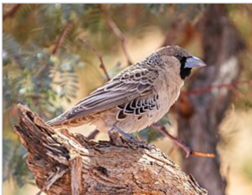
Un Républicain social à Sossusvlei en Namibie.

C'est un petit oiseau, mesurant 14 cm de long pour un poids allant de 26 à 30 grammes 1 .