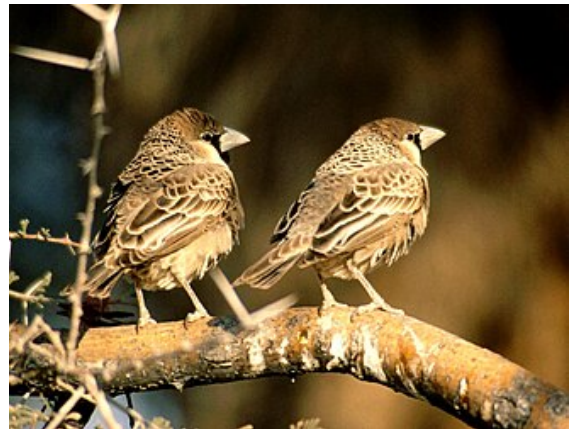
Couple de républicains, dans le parc national d'Etosha.