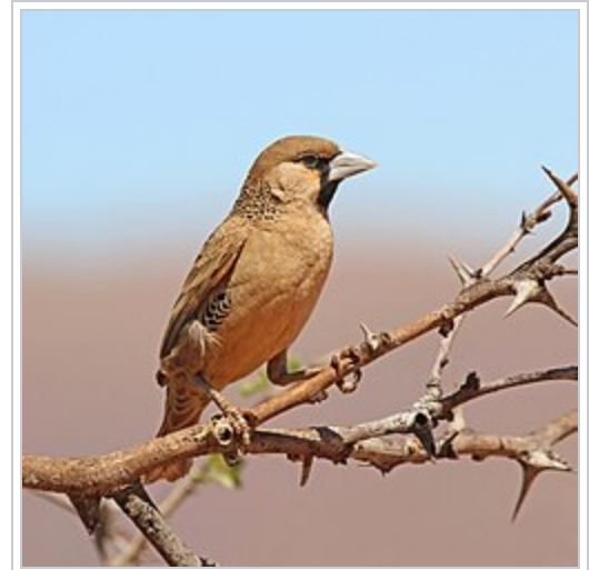
Un autre républicain social dans la Tswalu Kalahari Reserve (en) (Afrique du sud).

Éteint Menacé Préoccup. min. EX EW CR EN VU NT LC LC : Préoccupation mineure