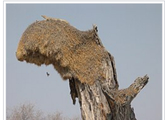
Un varan des savanes sur un nid de Républicains sociaux.