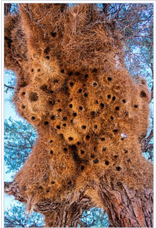
Des entrées de chambres vues de dessous.

On trouve quelquefois les sous-espèces P. s. eremus et P. s. lepidus , qui sont classiquement considérées comme synonyme de P. s. socius 5 .