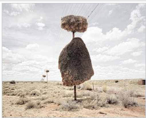
Nid d'une colonie sur un poteau dans le désert du Kalahari .

Ces oiseaux construisent des nids collectifs qui peuvent atteindre une taille énorme et servir à plusieurs générations successives, ce qui leur a valu leur nom. Ces nids comptent parmi les plus grandes structures construites par des oiseaux, et sont utilisés toute l'année. Ils sont très bien structurés,