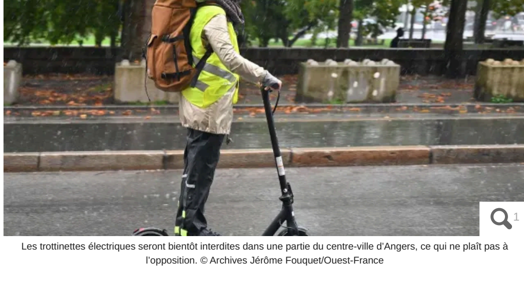
Les trottinettes électriques seront bientôt interdites dans une partie du centre-ville d'Angers, ce qui ne plaît pas à l'opposition.

Votre e-mail, avec votre consentement, est utilisé par la société Additi Com pour recevoir les newsletters sélectionnées. En savoir plus