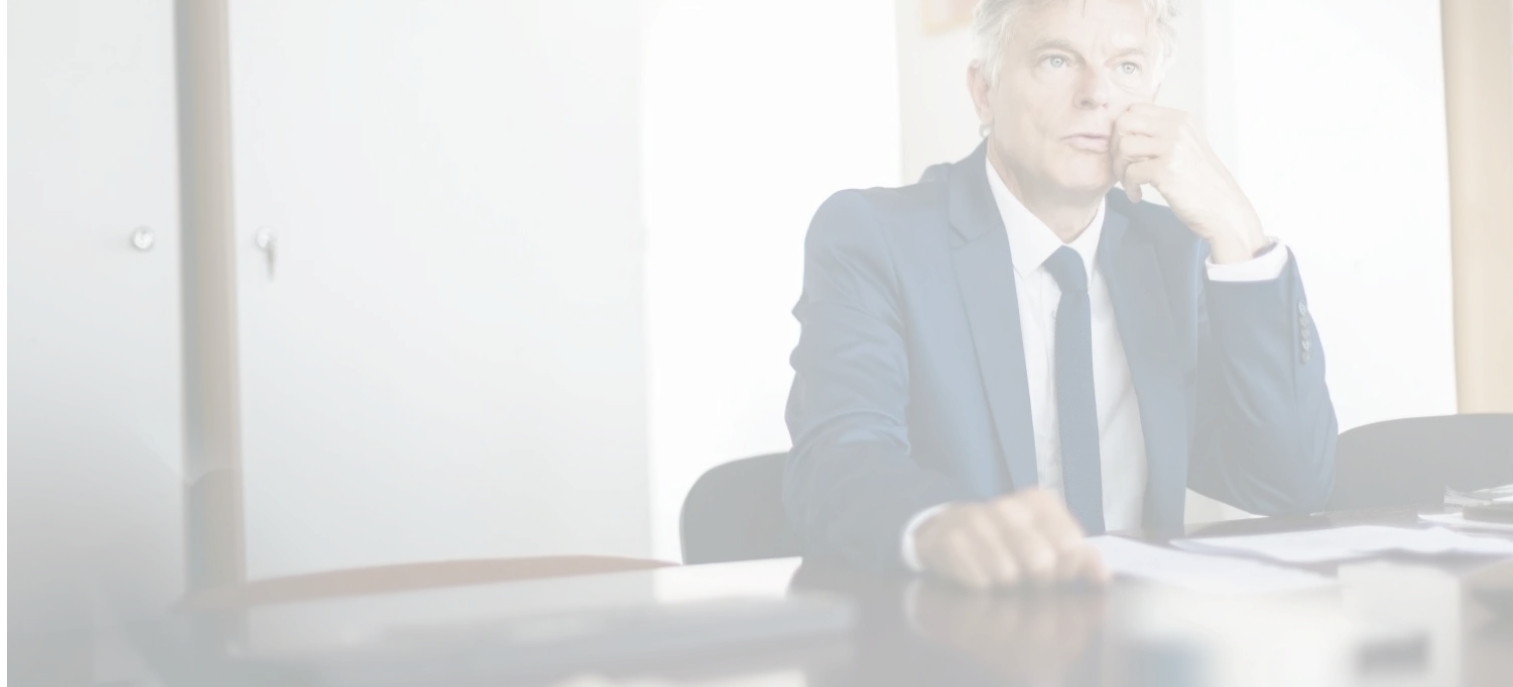
Le secrétaire national, Fabien Roussel, reçoit l'Humanité en amont du congrès, pour répondre aux questions brûlantes qui agitent la gauche et ont animé les débats dans les sections et les fédérations départementales du PCF.

C'est l'heure des choix décisifs pour le PCF. Les communistes ont rendez-vous à Lille (Nord), du 3 au 5 juillet, pour le 40 e congrès national du Parti, où seront fixées les grandes orientations stratégiques et idéologiques pour les trois prochaines années. Le secrétaire national, Fabien Roussel, reçoit l'Humanité en amont du congrès, pour répondre aux questions brûlantes qui agitent la gauche et ont animé les débats dans les sections et les fédérations départementales du PCF.